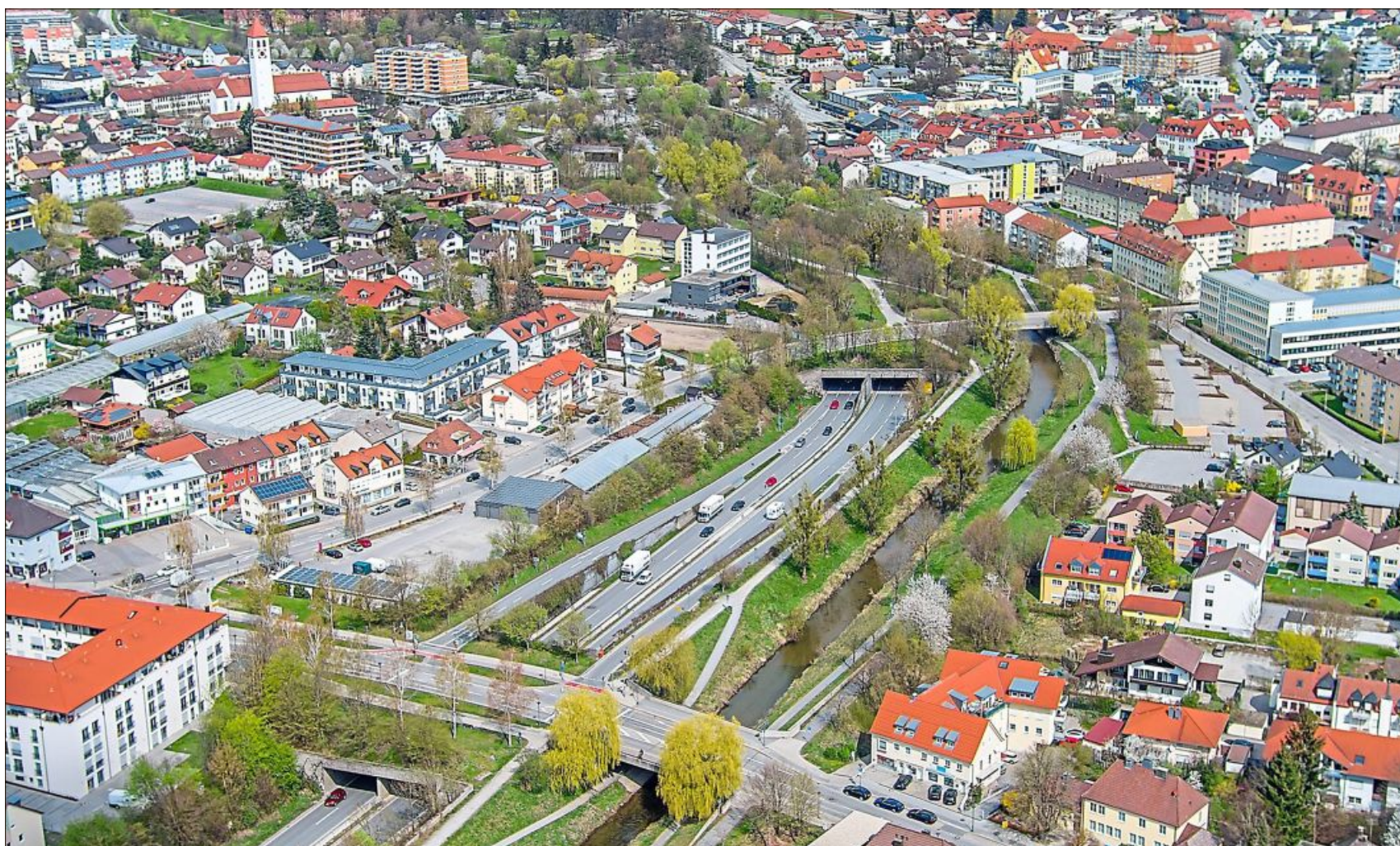
Heute verläuft die B11 in den Tunneln durch die Stadt. Daneben fließt der Bogenbach.