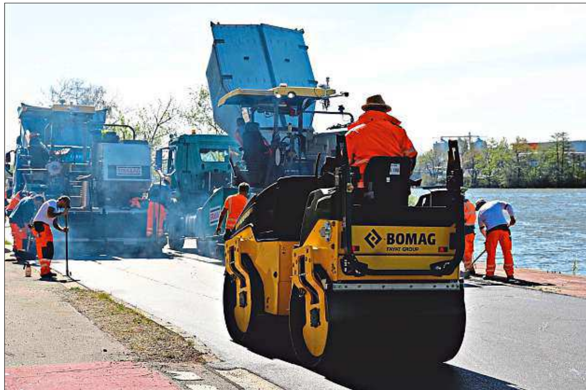
Spezieller Straßenbelag: Auf der Staatsstraße 2125 zwischen Gaißabrücke und Donauhof ist am Dienstag und Mittwoch asphaltiert worden.

Zwei Fertiger, speziell für den DSH-V-Asphalt ausgelegt, fuhren die Staatsstraße parallel ab, in der Lastwagenkolonne wartete der Asphalt auf seinen Einsatz. Eine dünne Asphaltdeckschicht – im Abschnitt zwischen Gaißa und Donauhof sind es gerade einmal zwei Zentimeter – wurde in Heißbauweise auf den frischen Asphalt aufgebracht.