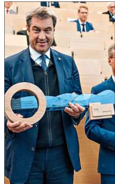
Ministerpräsident Markus Söder überreichte den Symbolschlüssel.

Beim Staatlichen Bauamt zeigte man sich begeistert vom Schlüssel. Dieser sei einer der schönsten symbolischen Schlüssel, die für öffentliche Bauten im Bereich des Passauer Bauamts je gemacht wurden, urteilte Norbert Sterl. Und auch