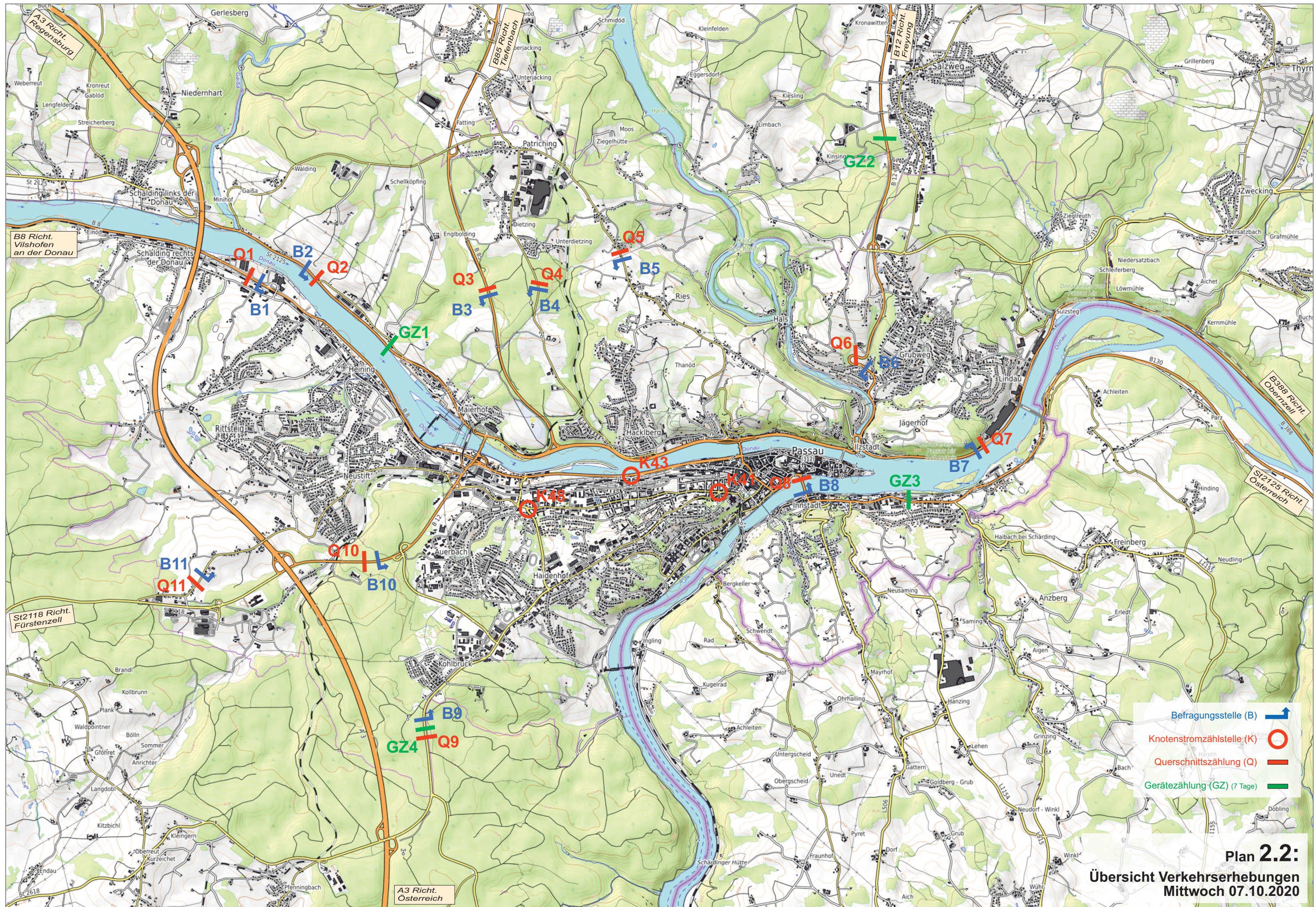
Plan 2.2: Übersicht Verkehrserhebungen Mittwoch 07.10.2020