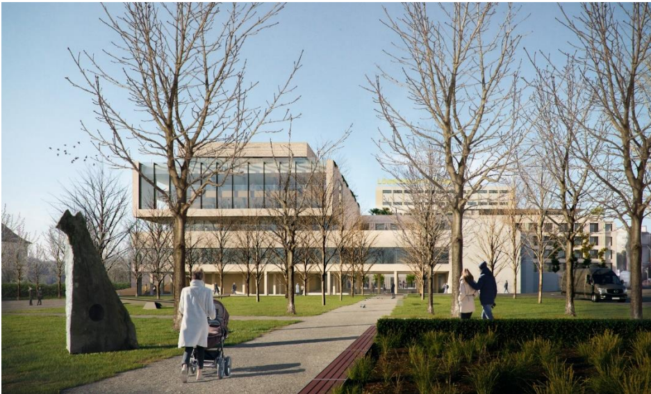
Bild 1: Blick aus dem Klostergarten zum künftigen Internationalen Wissenschaftszentrum der Universität Passau